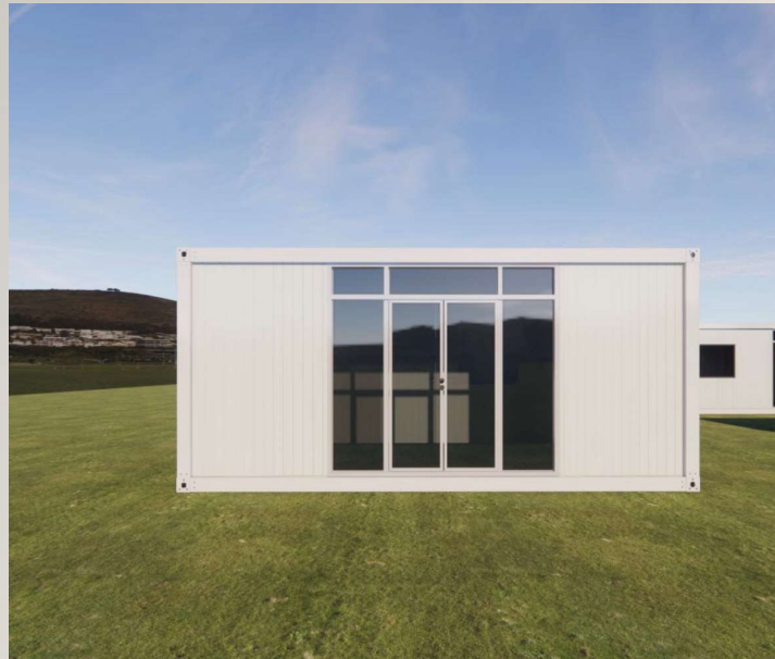
ガラス張り取り付け例