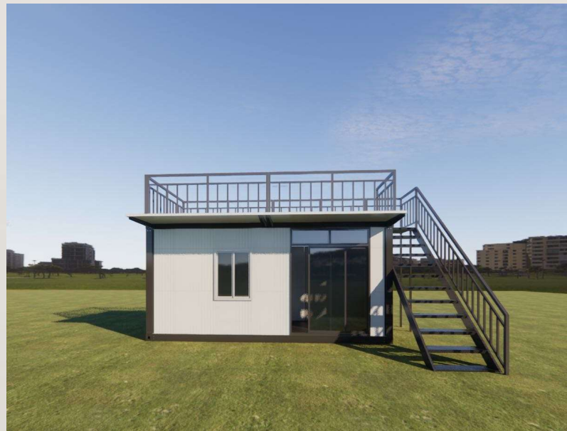
デッキ・庇・階段取り付け例